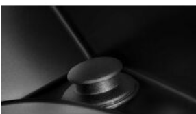
Додаткові розетки на 12 В S0575