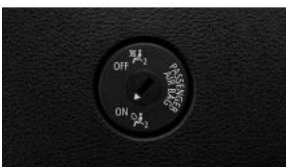
Деактивація подушки безпеки переднього пасажира S05DA