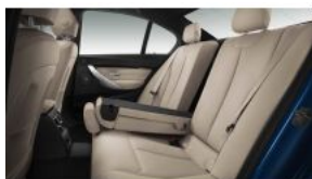
Система наскрізного завантаження S0465