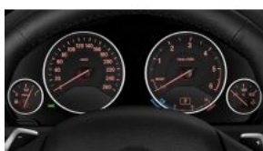
Панель приладів з розширеним змістом S06WA