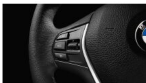
Круїз-контроль з функцією гальмування S0544