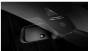
Датчик дощу і освітленості S0521