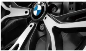
Болти-секретки для коліс S02PA