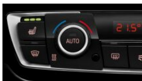
Підігрів передніх сидінь S0494