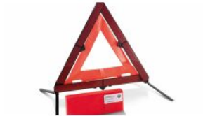
Знак аварійної зупинки і аптечка S0428