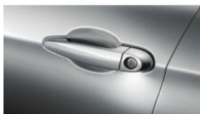
Розширений пакет освітлення салону S0563