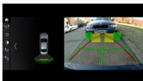
Камера заднього виду S03AG