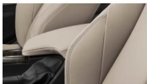
Передній регульований підлокітник S04AE