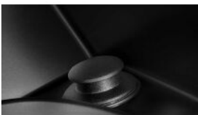
Додаткові розетки на 12 В S0575