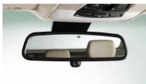
Салонне дзеркало заднього виду з автозатемненням S0431