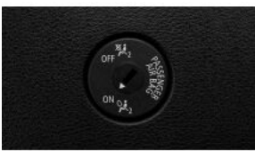
Деактивація подушки безпеки переднього пасажира S05DA