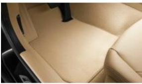
Велюрові килимки S0423