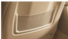
Відділення для зберігання S0493