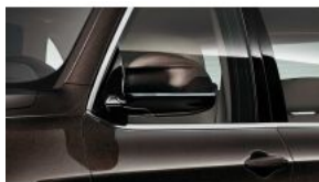
Дзеркала заднього виду з автозатемненням S0430