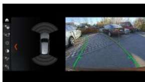
Камера заднього виду S03AG