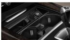
Підготовка автомобіля для курців S0441