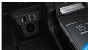
Додаткова розетка 12 вольт S0575