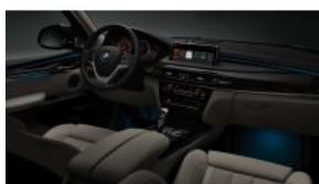
Розширений пакет освітлення салону S0563