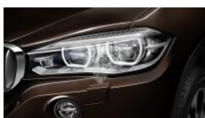
Система омивання фар S0502