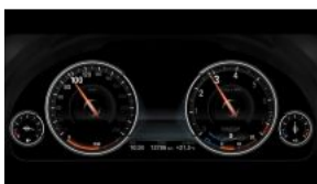
Багатофункціональний дисплей панелі приладів S06WB