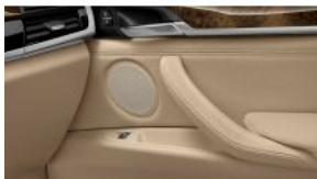
Акустична система HiFi S0676