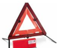
Знак аварійної зупинки і аптечка S0428